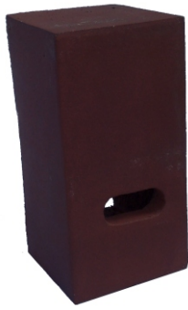
Fledermausstein Größe 1 240 x 120 x 120 mm (H;B;T) Gewicht ca. 3,8 kg