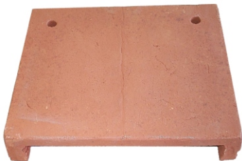
Fledermausbrett 250 x 300 x 60 mm (H;B;T) Gewicht ca. 3,8 kg