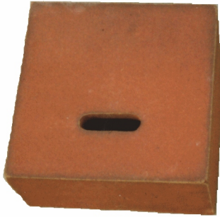
Fledermausstein Größe 2 240 x 240 x 120 mm (H;B;T) Gewicht ca. 7,0 kg