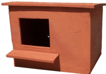
Turmfalken-Nistkasten ca. 39 x 52 x 39 cm (H;B;T) Gewicht ca. 46 kg