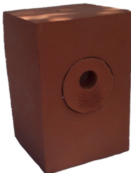
Meisenniststein 240 x 160 x 160 mm (H;B;T) Gewicht ca. 6,5 kg

Befestigung mittels Steinschrauben möglich